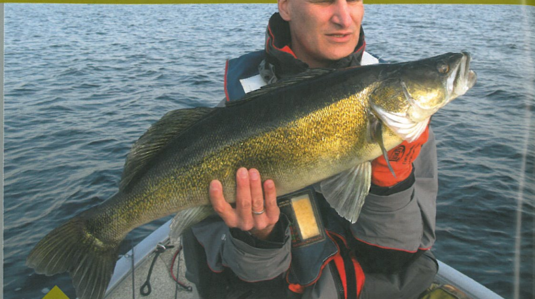
Gelijk naar aankomst gaan we nog even vissen. Die avond vangen we slechts één vis, een snoekbaars. Dit was ook gelijk de grootste snoekbaars van de hele visweek.