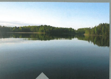
Een van de 3 ondiepere meren in de buurt, zat mogelijkheden voor casten.