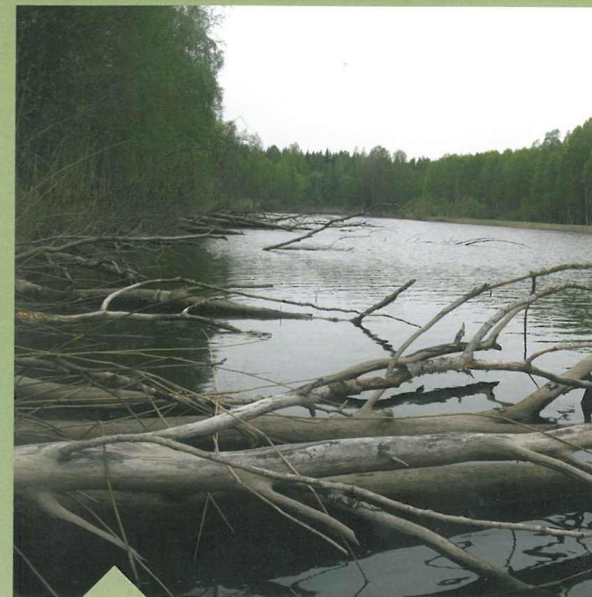
Het geheime riviertje